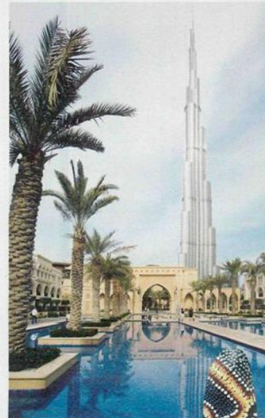
Sostenibile. Sopra, il Palace Hotel a Dubai, ai piedi del Burj Khalifa. Sotto, a sinistra, ibrida Bmw "i8" (132.500 €). A destra, un boomerang australiano.

«Un sogno? Avrei voluto diventare pilota. Adoro i siti di volo»